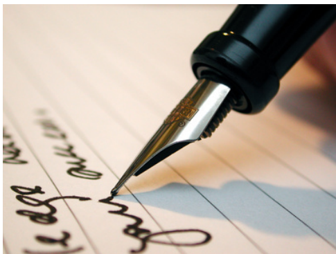
CV et lettre de motivation

Pour quels concours ces documents sont-ils exigés ?